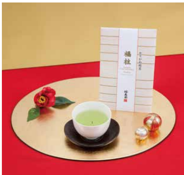
新商品「かりがね銘茶 福柱」40g袋入 (税込)1,296円

「かりがね銘茶 福柱40g袋入」は、茶園に覆いをして丁寧に育てた玉露の茎(かりがね)を柱に見立てた逸品です。渋味が少なくまったりとした旨味ながらも清々しい香りが特徴のお茶になります。パッケージデザインは、繁栄や長寿を願う象徴である年輪を刻んだ宮柱をイメージしております。年末やお正月などのおめでたい席で「福を呼び込む縁起物」として楽しんでいただけます。